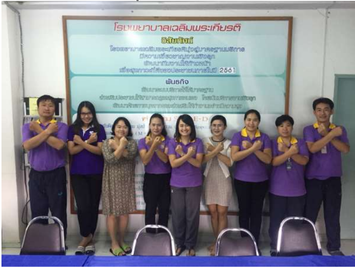
๓.๑ ภาพถ่ายการประกาศเจตนารมณ์ของผู้บริหาร